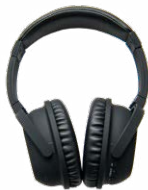
Słuchawki nauszne WAPOZSLU1