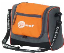
Futurał M6 WAFUTM6