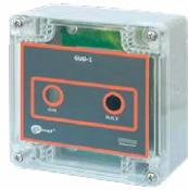
Nadajnik ultradźwiękowy GUD-1 WMGBGUD1