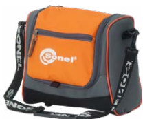
Futurał M6 WAFUTM6